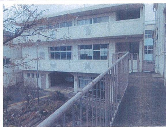
聖堂外部スロープから信徒会館を撮影