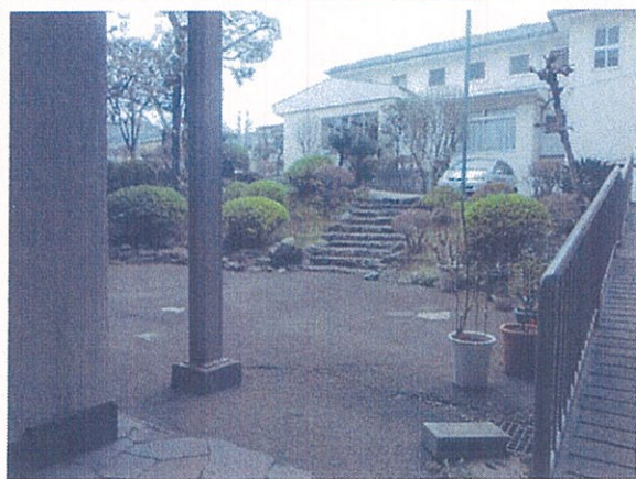
地下マイエホールから司祭館を撮影