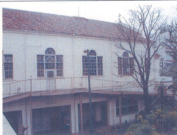
1階聖堂、地下マイエホール